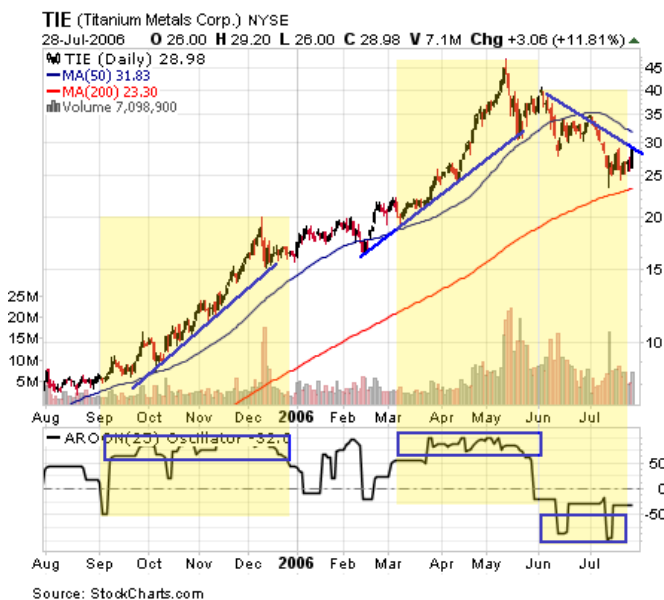
Дневной график TIE. Осциллятор Aroon.

Давайте взглянем на тот же самый график с использованием осциллятора: